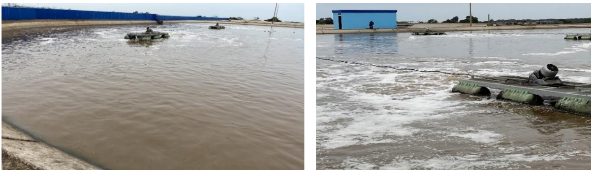
Fig. 5 PTAR El Cortijo: Laguna aireación N°2 con equipos OxyStar® OS30 en operación en 2022

En el 2022, FUCHS Enprotec GmbH, visitó la planta de tratamiento y pudo comprobar por sí mismo la gran mejora que ha supuesto para la planta misma y el tratamiento, la instalación de los aireadores FUCHS OxyStar®.