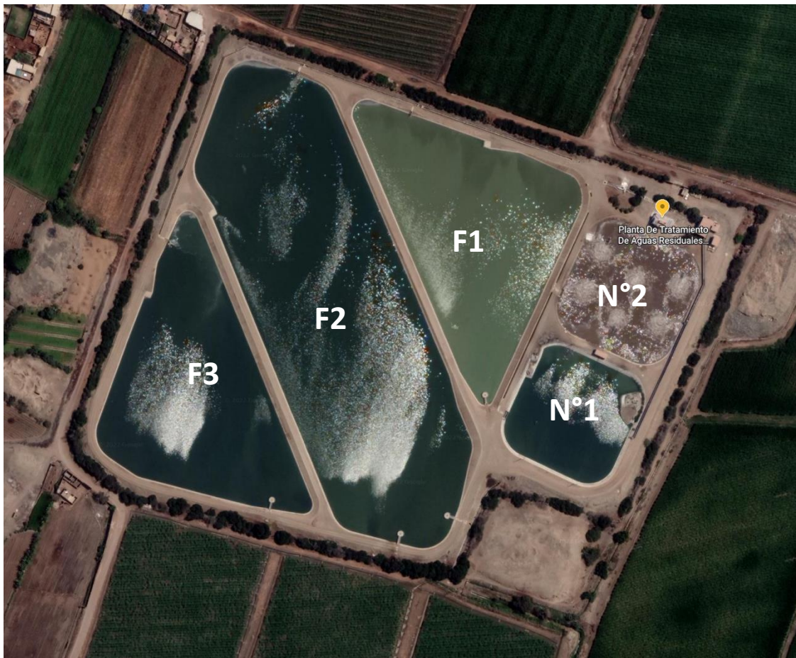
Fig. 1 PTAR El Cortijo: ubicación de las lagunas aireadas y facultativas

La planta cuenta con un sistema de tratamiento de 5 lagunas que operan en paralelo. Dos lagunas aireadas N°1-N°2 y 3 lagunas facultativas F1, F2, F3 consecutivamente.