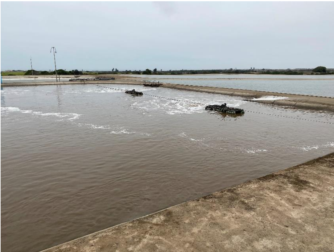
Fig. 3 PTAR El Cortijo: Laguna aireación N°2 con equipos OxyStar® OS30 en operación en 2022

Mientras en el diseño original de la PTAR fueron contemplados 4 aireadores de 30 kW, se optó por la adquisición de equipos nuevos, adquiriendo un total de 6 aireadores de 22 kW. Gracias a esta adopción del diseño, propuesto por el proveedor, con el número adecuado de aireadores y su distribución uniforme sobre la superficie de la laguna, se garantiza que haya condiciones óptimas de tratamiento y una distribución adecuada de la potencia disponible. De esta forma, tanto los niveles de aireación como de mezcla sean los requeridos para el tratamiento que se busca.