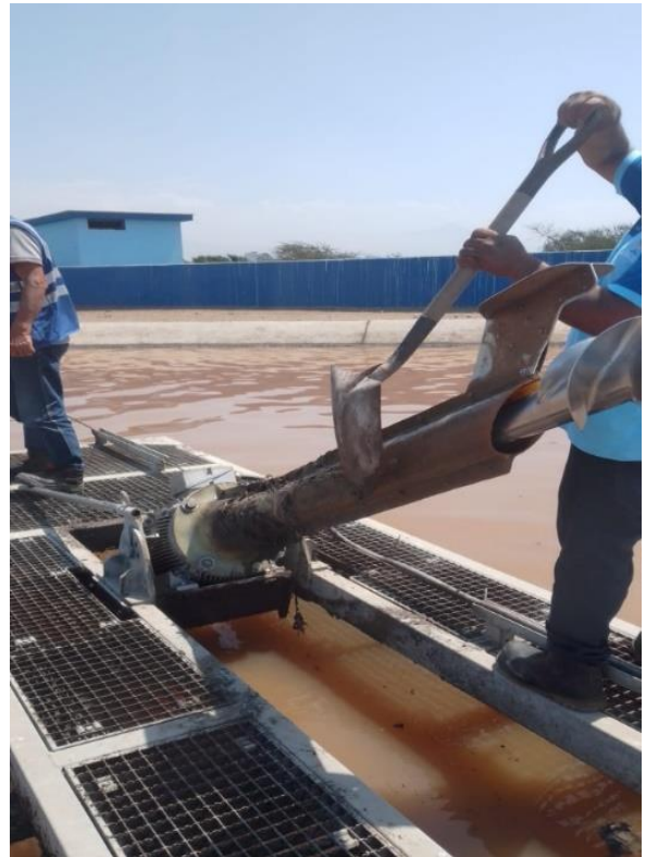
Fig. 6 Condición del rotor libre de materiales enredados o fibrosos, sin anomalías en el eje hueco. Conjunto en óptimo estado mecánico y de funcionamiento. Detalle de faena mantenimiento en plataforma.

Por último, tras el éxito de esta instalación inicial, el cliente también está interesado en futuras ampliaciones y renovaciones con la posibilidad de incluir nuestros aireadores FUCHS OxyStar®, no sólo para lo que resta en la PTAR El Cortijo, sino también para la adecuación y remodelación de otra planta de tratamiento de aguas residuales cercana que es de suma importancia para la ciudad de Trujillo.